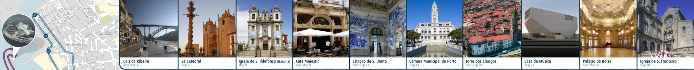
Cais da Ribeira near stop 1 | Sé Catedral stop 7 | Igreja de S. Ildefonso (batalha) stop 9 | Café Majestic near stop 9 | Estação de S. Bento near stop 12 | Câmara Municipal do Porto stop 14 | Torre dos Clérigos near stop 18 | Casa da Música stop 24 | Palácio da Bolsa near stop 40 | Igreja de S. Francisco stop 40