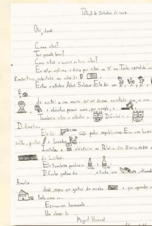
Carta charada dos Alunos do Colégio Tangerina