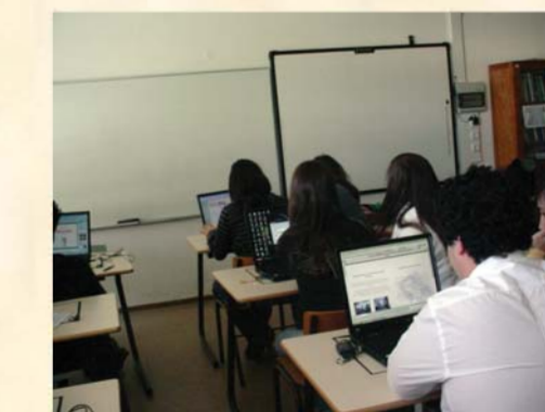
Alunos Escola Secundária Abel Salazar, a trabalhar no projecto Abel Salazar