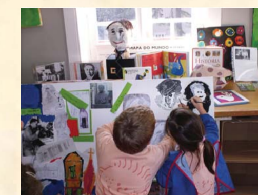
Alunos do Colégio Tangerina, a trabalhar no Projecto Abel Salazar