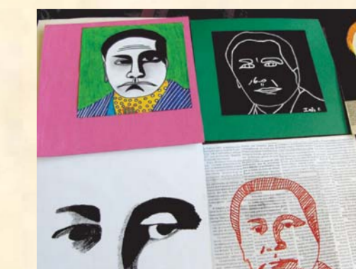
Trabalhos sobre Abel Salazar, realizados no Colégio N. S. Rosário